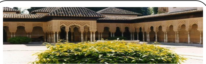
La Alhambra, Grenade.